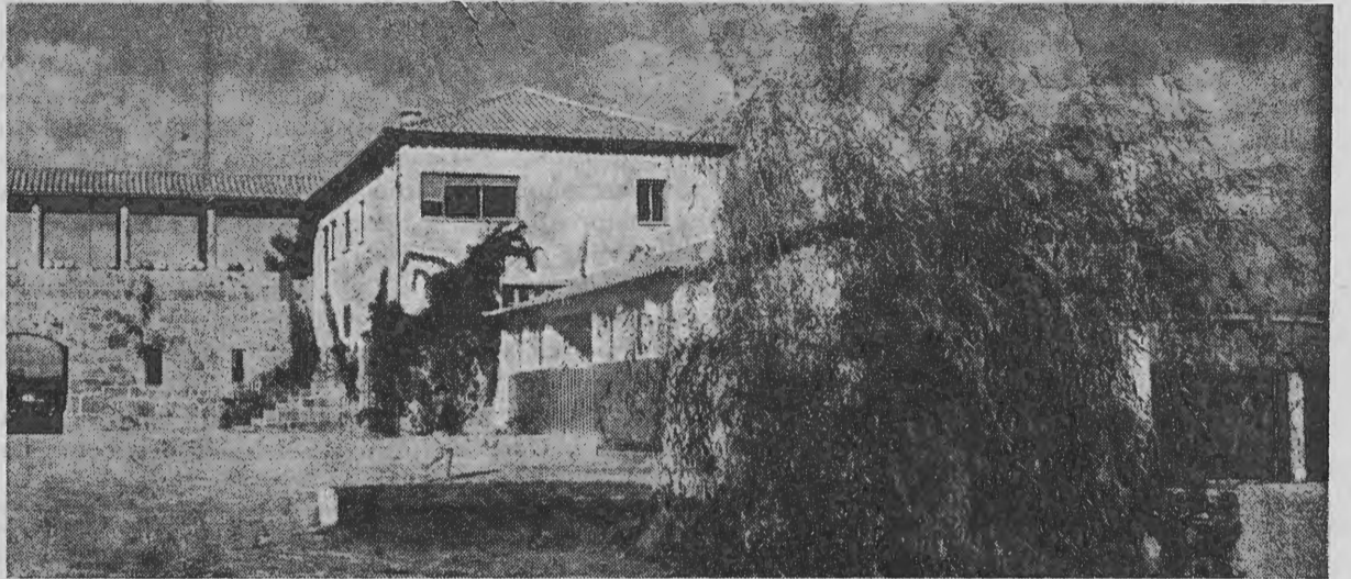
UM BELO RECANTO DA CASA DO GAIATO DE BEIRE — PAREDES, NA MESMA QUINTA DO NOSSO «CALVÁRIO».